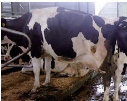
写真1. パーチングする牛

多数の牛が密集し起立する、パーチング（写真1）等の行動が見られるようになり、蹄への負担が増します。