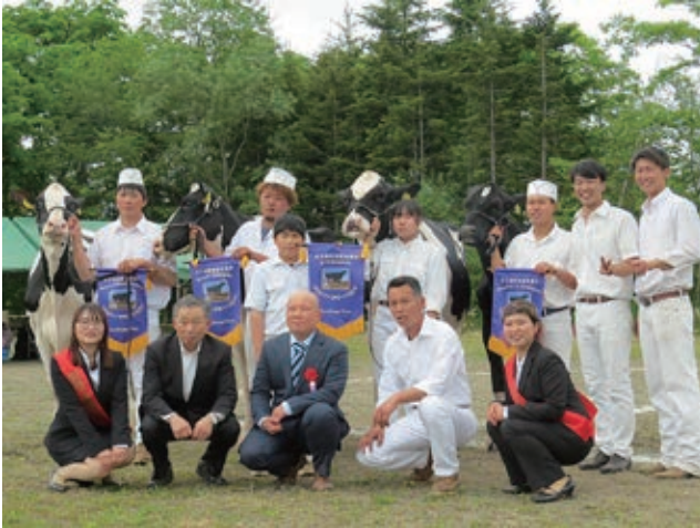
↑ 弟子屈町家畜共進会場(弟子屈町鑑別)にて記念撮影