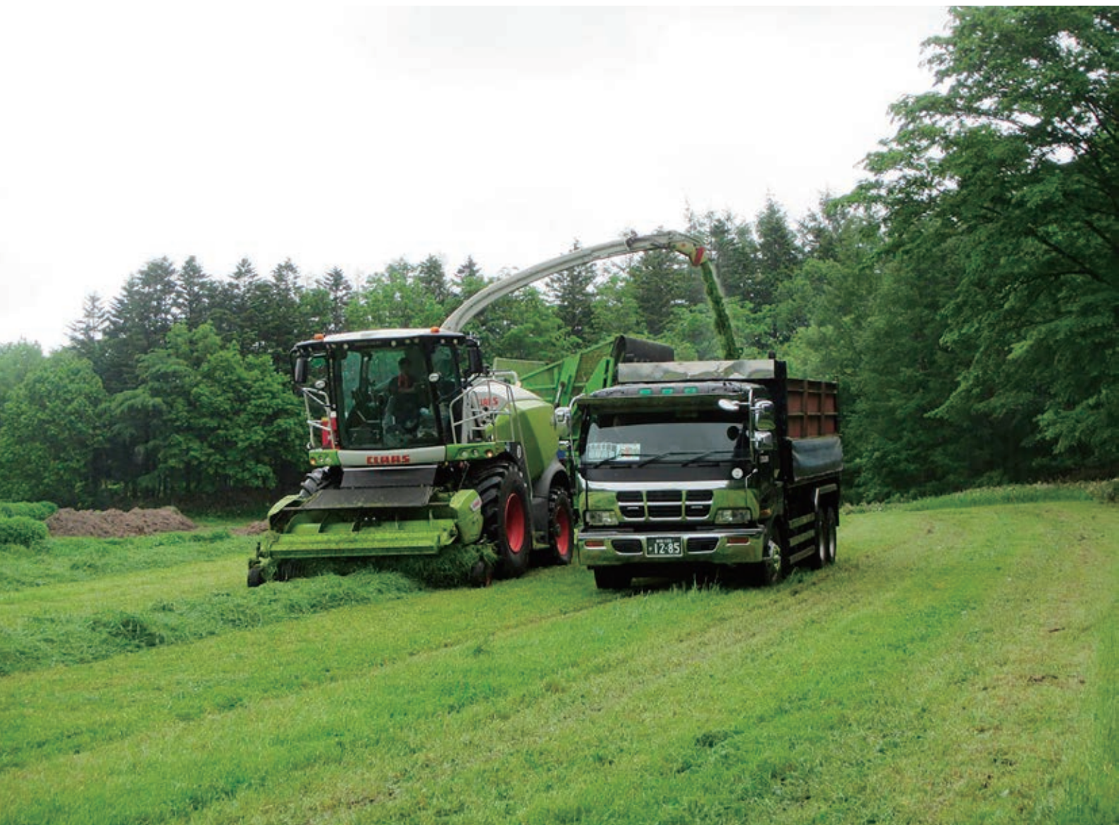
(一番草刈り開始！ 関連記事3P)