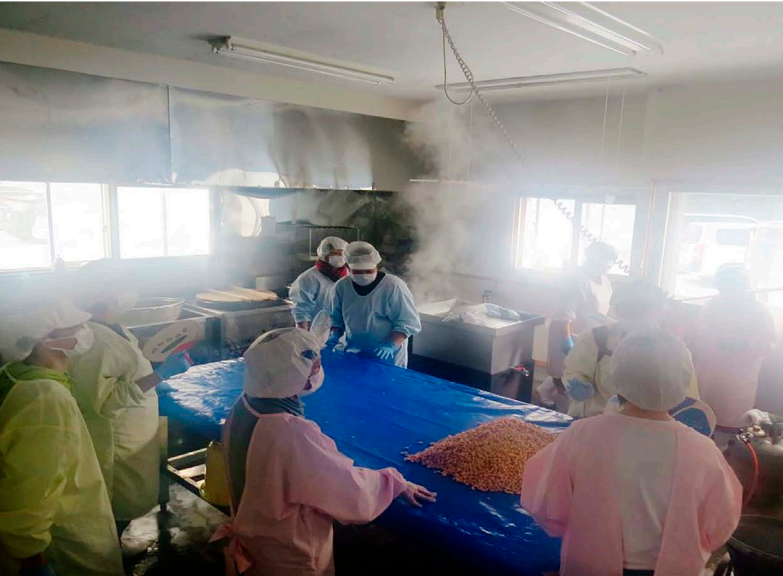
(女性部みそ仕込み作業 関連記事3P)