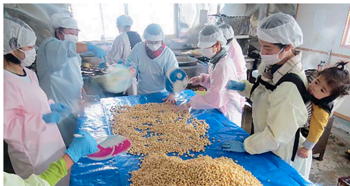
一つ一つ丁寧に美味しい味噌作りをしています♪