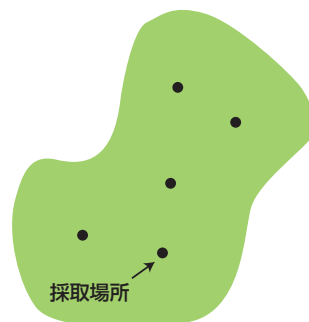
図2 土壌採取場所の例