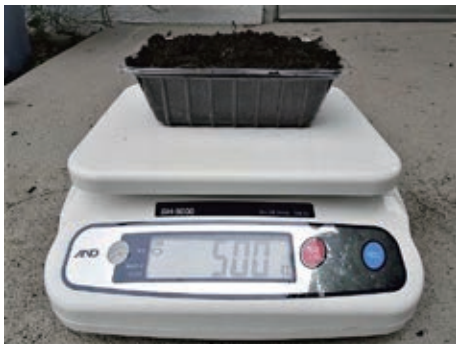
写真1 必要なサンプル量

分析用の土壌サンプルは生土500g程度です。目安として、イチゴパックでおよそ一杯になります（写真1）。